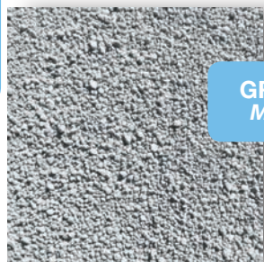
GRANULARE MEDIO MEDIUM GRANULES

Available in bags or buckets (buckets are also suitable for the collection of the product after use) are a practical solutions to satisfy different needs.